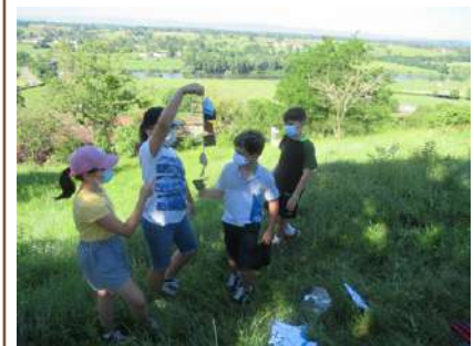
Sensibilisation au paysage en milieu scolaire (Brionnais, 2021)