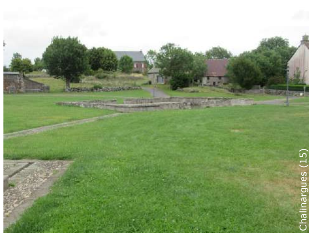
Espaces simplement enherbés autour des lavoirs, en site semi-naturel ou en centre-bourg.