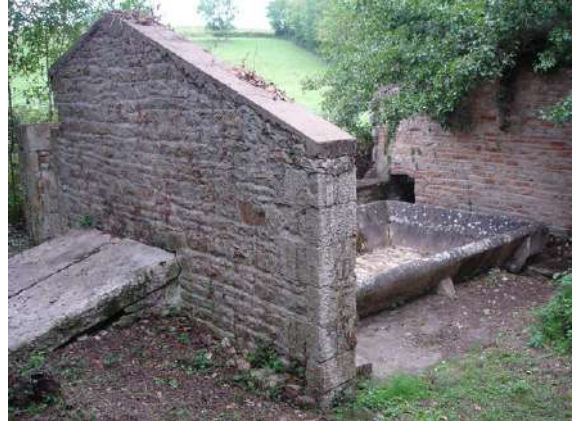
Ouvrage nettoyé et dégagé. Le dallage entourant le bassin est bien visible.