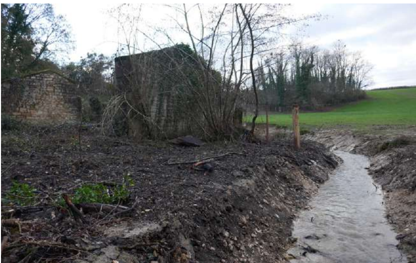
La lisière du pré derrière le lavoir a été creusé, créant un ruisseau détournant l'eau du lavoir.