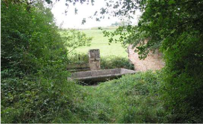
Vue d'ensemble du lavoir. Photo de 2010, avant nettoyage.

Les vestiges d'un remplissage de brique révèlent une ancienne protection contre le vent. La percée visuelle vers les prés et le paysage en arrière-plan est plutôt bienvenue, apportant ouverture, profondeur, et belles lumières à l'ensemble.