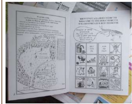
Comment reconnaître quelques arbres ? Site de la Boucherette - Réalisation Lugny Patrimoine avec le collège Victor Hugo

Un écologue pourra être missionné pour un inventaire du site, en parallèle de la restauration du lavoir, entreprise par un spécialiste des ouvrages en pierre.